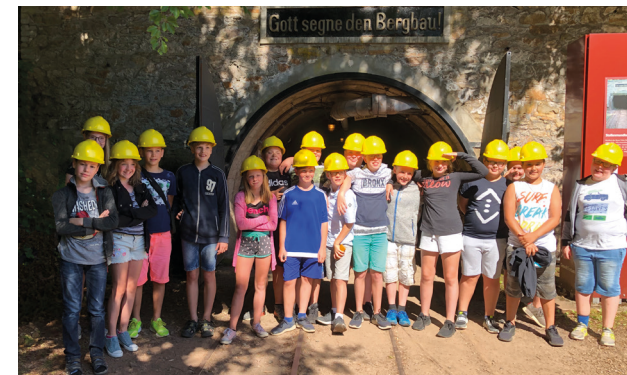
SchülerInnen im Besucherbergwerk

Die reale Begegnung mit der räumlichen Wirklichkeit führt zu einer stärkeren Motivation als der „normale“ Unterricht. So erkunden wir z.B. in Klasse 5 die Grube Fortuna in Solms-Oberbiel, in Klasse 6 findet z.B. die fünftägige Naturerlebnisfahrt innerhalb Deutschlands (Vulkaneifel, Nord- oder Ostsee) sowie die Teilnahme am Krimilabor im Chemikum in Marburg statt, um u.a. das Interesse am naturwissenschaftlichen Unterricht zu wecken.