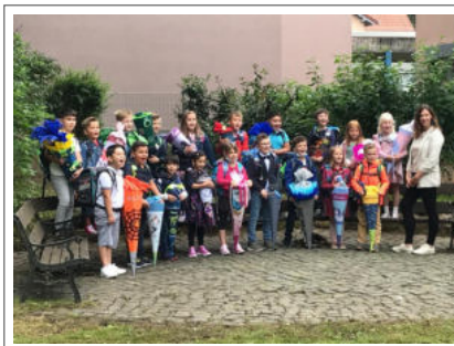
1c 1b (Kuhn) (Lixfeld)